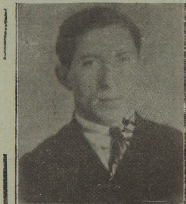
La presente schedina sostituisce ed annulla la precedente N. 3770 anno 931. Questore Bologna, 2. 10. 931.